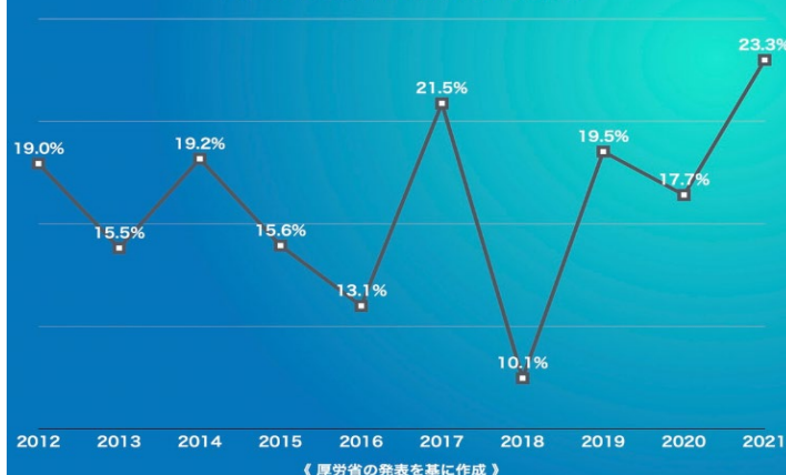
ケアマネ試験の直近10年の合格率

活動報告 冷え込みが強く、気候の変わり目。時節柄、体調を崩される方が多く見られます。ケアマネの研修を受けました。支援をうける方も、周回の感情を二次受けていく柄、無自覚に共感しながら疲弊していき、バインアウトしながら、疎かになりやすくなります。ケアの重